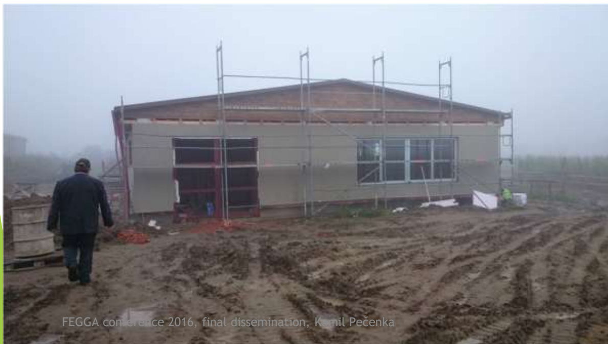
FEGGA conference 2016, final dissemination, Kamil Pečenka